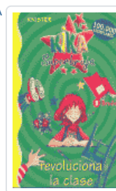
KIKA SUPERBRUJA REVOLUCIONA LA CLASE KNISTER