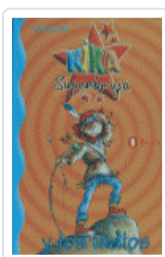
KIKA SUPERBRUJA Y LOS INDIOS KNISTER