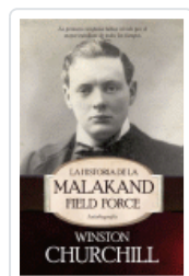
HISTORIA DE LA MALAKAND FIELD FORCE. AUTOBIOGRAFIA CHURCHILL, WINSTON