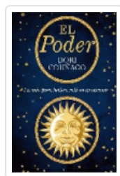
PODER, EL COUÑAGO, DORI