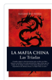
MAFIA CHINA, LA TRIADAS, SOCIEDADES SECRETAS RIERA, ALEJANDRO