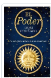
PODER, EL COUÑAGO, DORI