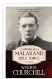
HISTORIA DE LA MALAKAND FIELD FORCE. AUTOBIOGRAFIA CHURCHILL, WINSTON