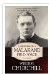
HISTORIA DE LA MALAKAND FIELD FORCE. AUTOBIOGRAFIA CHURCHILL, WINSTON