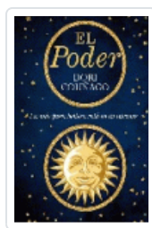
PODER, EL COUÑAGO, DORI