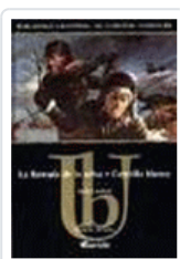
LLAMADA DE LA SELVA.LA- COLMILLO BLANCO LONDON, JACK