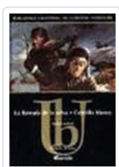
LLAMADA DE LA SELVA.LA-COLMILLO BLANCO LONDON, JACK