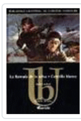
LLAMADA DE LA SELVA.LA-COLMILLO BLANCO LONDON, JACK