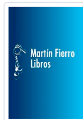
POR LA LIEBRE (OBRA PERIODISTICA 4) GARCIA MARQUEZ, GABRIEL