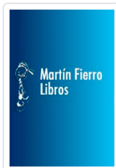
NOTICIA DE UN SECUESTRO GARCIA MARQUEZ, GABRIEL