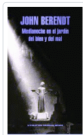
MEDIANOCHE EN EL JARDIN DEL BIEN Y DEL MAL BERENDT, JOHN