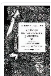
CUENTOS DE IMAGINACION Y MISTERIO POE, E.A.