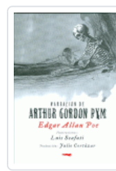
NARRACION DE ARTHUR G. PYM POE, EDGAR ALLAN