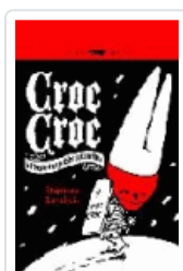
CROC-CROC LEVALLOIS, STEPHANE