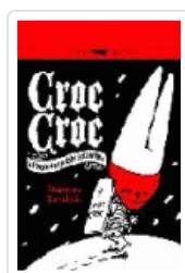
CROC-CROC LEVALLOIS, STEPHANE