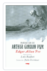
NARRACION DE ARTHUR G.PYM POE, EDGAR ALLAN