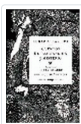
CUENTOS DE IMAGINACION Y MISTERIO POE, E.A.