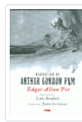
NARRACION DE ARTHUR G. PYM POE, EDGAR ALLAN