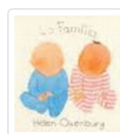
FAMILIA (CATALAN) HELEN OXENBURY