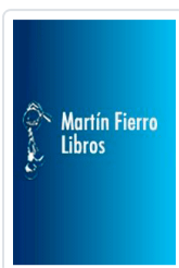
POR LA LIEBRE (OBRA PERIODISTICA 4) GARCIA MARQUEZ, GABRIEL