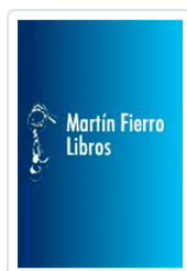
NOTICIA DE UN SECUESTRO GARCIA MARQUEZ, GABRIEL