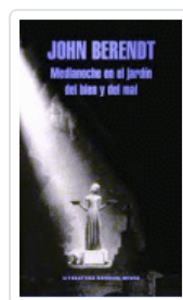
MEDIANOCHE EN EL JARDIN DEL BIEN Y DEL MAL BERENDT, JOHN