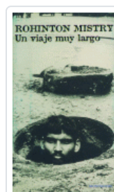
VIAJE MUY LARGO, UN MISTRY, ROHINTON