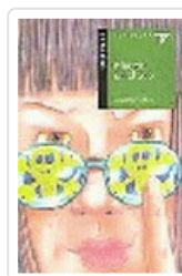
MUERTE EN EL ZOO (ALA DELTA 27) VILLAR LIEBANA, LUISA