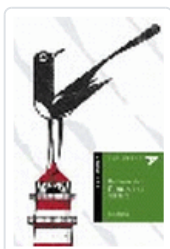
HABLAME DEL FANTASMA DEL FARO-ALADELTA26 BLANCO, TINA