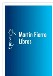
NOTICIA DE UN SECUESTRO GARCIA MARQUEZ, GABRIEL