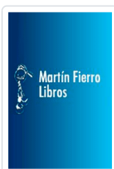
POR LA LIEBRE (OBRA PERIODISTICA 4) GARCIA MARQUEZ, GABRIEL