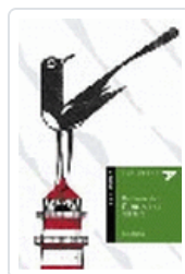
HABLAME DEL FANTASMA DEL FARO-ALADELTA26 BLANCO, TINA