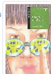
MUERTE EN EL ZOO (ALA DELTA 27) VILLAR LIEBANA, LUISA