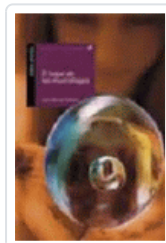
LUGAR DE LOS MURCIELAGOS, EL (ALANDAR 33) GISBERT, JOAN MANUEL