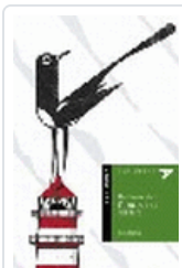
HABLAME DEL FANTASMA DEL FARO-ALADELTA26 BLANCO, TINA