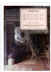
ESTILO RUSTICO MILLER