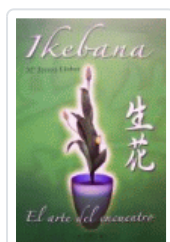
IKEBANA. ARTE JAPONÉS COMPOSICION FLORAL PALMER, ELISAB.