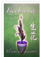
IKEBANA. ARTE JAPONÉS COMPOSICION FLORAL PALMER, ELISAB.