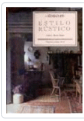
ESTILO RUSTICO MILLER