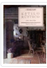
ESTILO RUSTICO MILLER