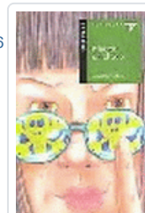
MUERTE EN EL ZOO (ALA DELTA 27) VILLAR LIEBANA, LUISA