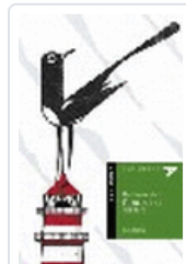
HABLAME DEL FANTASMA DEL FARO-ALADELTA26 BLANCO, TINA