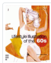
LIFESTYLE ILLUSTRATION OF THE 60S HUGHES, RIAN