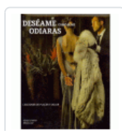
DESEAME COMO SI ME ODIARAS O'HARA, VENUS/LUST, ERIKA