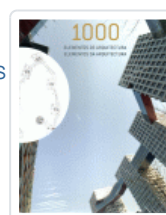
1000 ELEMENTOS DE ARQUITECTURA VV.AA.