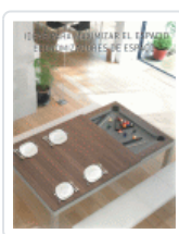
IDEAS PARA MAXIMIZAR EL ESPACIO ECONOMIZADORES DE ESPACIO VV.AA.