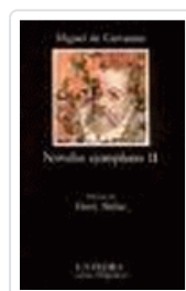
NOVELAS EJEMPLARES CERVANTES