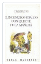
INGENISO DON QUIJOTE DE LA MANCHA, 2 VOLS. 203. CERVANTES