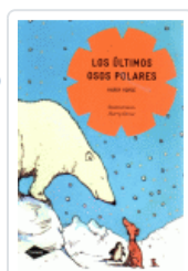
ULTIMOS OSOS POLARES, LOS (COMETA) HORSE, HARRY