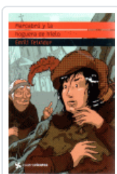
MARCABRU Y LA HOGUERA DE HIELO (CUATROVIENTOS) TEIXIDOR, EMILI