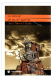
MANSION DE LAS MIL PUERTAS, LA (CUATROVIENTOS) SIERRA I FABRA, JORDI