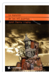
MANSION DE LAS MIL PUERTAS, LA (CUATROVIENTOS) SIERRA I FABRA, JORDI