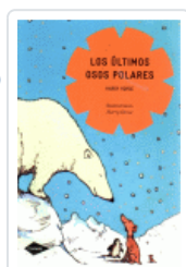
ULTIMOS OSOS POLARES, LOS (COMETA) HORSE, HARRY