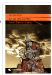
MANSION DE LAS MIL PUERTAS, LA (CUATROVIENTOS) SIERRA I FABRA, JORDI