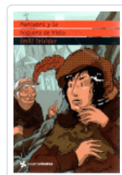
MARCABRU Y LA HOGUERA DE HIELO (CUATROVIENTOS) TEIXIDOR, EMILI