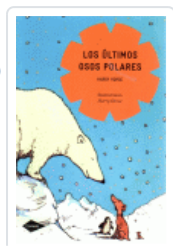
ULTIMOS OSOS POLARES, LOS (COMETA) HORSE, HARRY