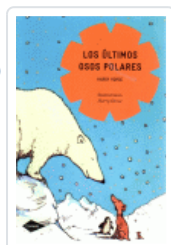
ULTIMOS OSOS POLARES, LOS (COMETA) HORSE, HARRY