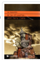
MANSION DE LAS MIL PUERTAS, LA (CUATROVIENTOS) SIERRA I FABRA, JORDI