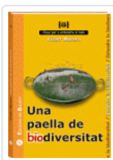
PAELLA DE BIODIVERSITAT (CLAUS PER ENTENDRE EL MON 14) MORERA FERRANDO, VICENT