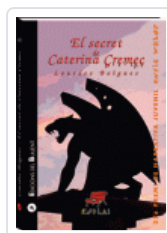
SECRET DE CATERINA CREMEC (ESPLAI 40) BOIGUES CHORRO, LOURDES