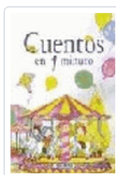
CUENTOS EN UN MINUTO