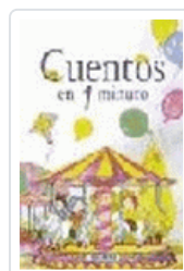
CUENTOS EN UN MINUTO