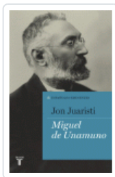
MIGUEL DE UNAMUNO. ESPAÑOLES EMINENTES JUARISTI, JON