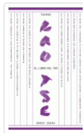
LIBRO DEL TAO. EL BANERJEE, ABHIJIT VINAYAK/ DUFLO, ESTHER