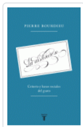
DISTINCION, LA. CRITERIO Y BASES SOCIALES DEL GUSTO BOURDIEU, PIERRE