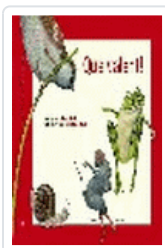
¡Qué valiente! (CATALAN)