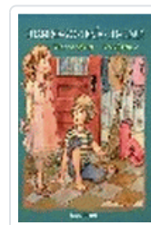
CUANDO YO TENIA TU EDAD