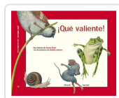
¡Qué valiente! PAULI