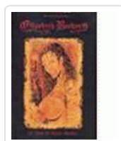
ELIZABETH BATHORY: VIAJE DEL ATAUD MALDITO CACERES, RAULO