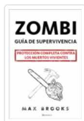
ZOMBI GUÍA DE SUPERVIVENCIA BROOKS, MAX