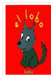
LOBO, EL KIMIKO