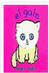
GATO, EL MITSUKO/KIMIKO