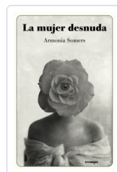
MUJER DESNUDA, LA SOMERS, ARMONIA