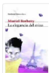
ELEGANCIA DEL ERIZO, LA BARBERY, MURIEL