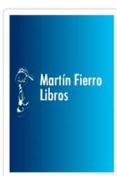
LADRON DE ARTE, EL CHARNEY