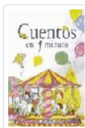
CUENTOS EN UN MINUTO