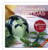
45 RECETAS CON ORTIGAS 2º ED. ALVAREZ GONZALEZ, MARTIN