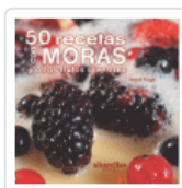
50 RECETAS CON MORAS Y OTROS FRUTOS SILVESTRES FRAGA SANCHEZ, XESUS