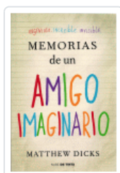
MEMORIAS DE UN AMIGO IMAGINARIO DICKS, MATTHEW