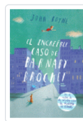
INCREDIBLE CASO DE BARNABY BROCKETT, EL BOYNE, JOHN