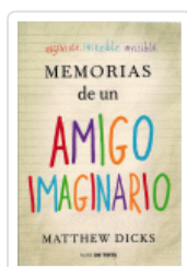
MEMORIAS DE UN AMIGO IMAGINARIO DICKS, MATTHEW