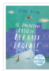
INCREDIBLE CASO DE BARNABY BROCKET, EL BOYNE, JOHN