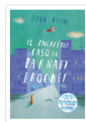
INCREDIBLE CASO DE BARNABY BROCKET, EL BOYNE, JOHN