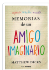
MEMORIAS DE UN AMIGO IMAGINARIO DICKS, MATTHEW