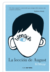
WONDER LA LECCION DE AUGUST (1) PALACIO, R.J.