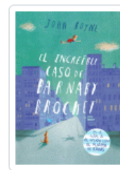
INCREDIBLE CASO DE BARNABY BROCKET, EL BOYNE, JOHN