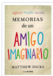
MEMORIAS DE UN AMIGO IMAGINARIO DICKS, MATTHEW