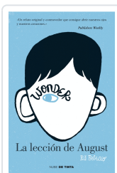
WONDER LA LECCION DE AUGUST (1) PALACIO, R.J.