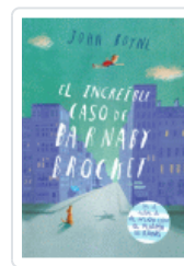
INCREIBLE CASO DE BARNABY BROCKET, EL BOYNE, JOHN