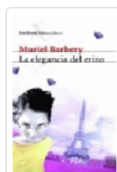
ELEGANCIA DEL ERIZO, LA BARBERY, MURIEL