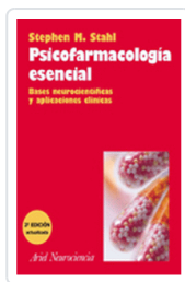
PSICOFARMACOLOGIA ESENCIAL 2º ED STAHL