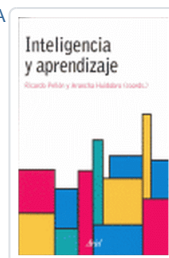
INTELIGENCIA Y APRENDIZAJE PELLON/HUIDOBRO (COORDS.)