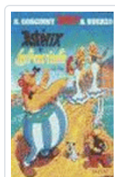
*ASTERIX - LATRAVIATA Nº 32