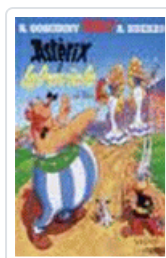
ASTERIX I LA TRAVIATA (CAT)