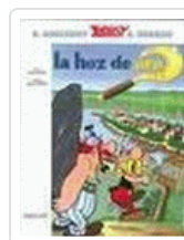
*ASTERIX - HOZ DE ORO (2)