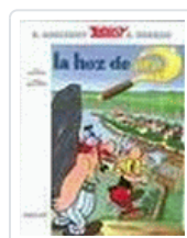
*ASTERIX - HOZ DE ORO (2)