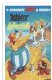
*ASTERIX - LATRAVIATA Nº 32