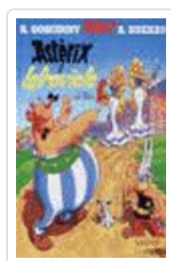
ASTERIX I LA TRAVIATA (CAT)