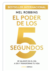
PODER DE LOS 5 SEGUNDOS, EL ROBBINS, MEL